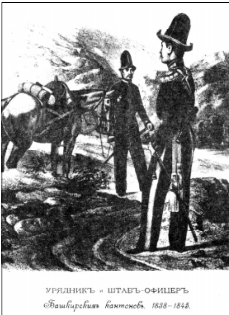
УРЯДНИКЪ « ШТАБЪ-ОФИЦЕРЪ Башкирскихъ кантоновъ. 1838-1845.

В 1850-1853 г. служил помощником начальника, а затем начальником 7-го Башкирского кантона. В 1853-1855 г. нахо-